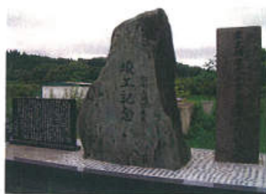
「船引地区」の竣工記念碑