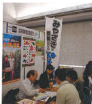
新・農業人フェア (昨年)