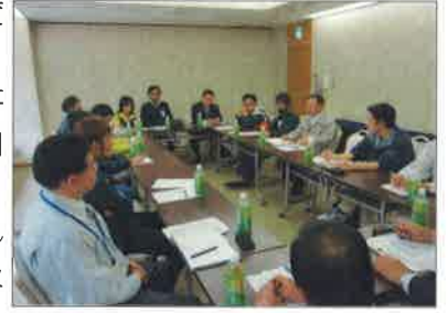
セミナーの様子(分科会)