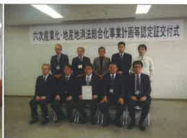
延岡地域センターでの交付式 (3/14 : 1件)