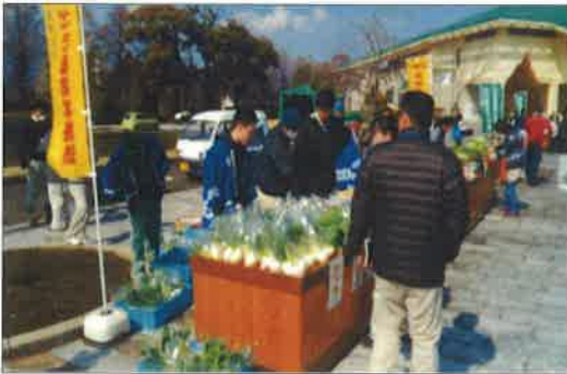
農業大学校内での直売体験

本講座に参加されたお二人は、農業の楽しさや厳しさの一端を経験され、自分の今までの人生の中で、大変充実した一週間を体験できましたという感想を述べられました。このような催しを通じて、本県農業への関心の高まりや、本県での就農に向けた取り組みを始められる方が増えることを期待したいものです。