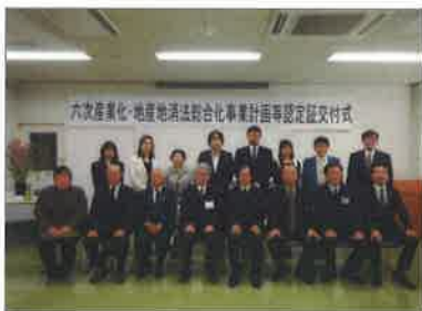
宮崎地域センターでの交付式 (3/12 : 10件)