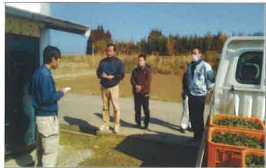
実践塾OBの体験談を聞く参加者