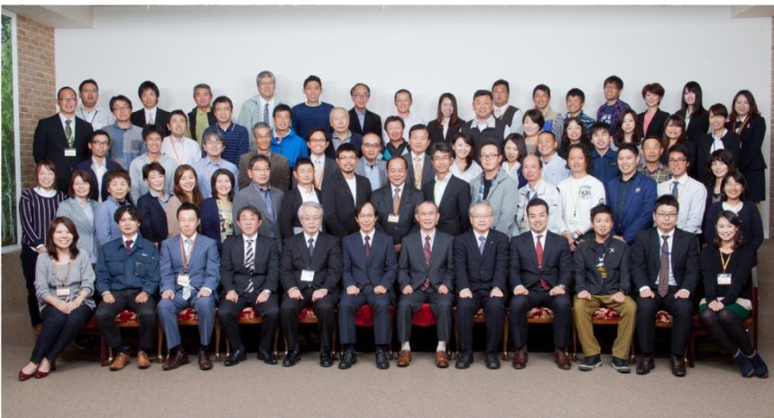
平成26年度みやざき6次産業化チャレンジ塾 閉講式 於 ニューウェルシティ宮崎 (H26.11.11)