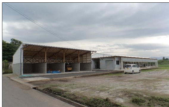
都城市 8 団地 堆肥舎および繁殖牛舎