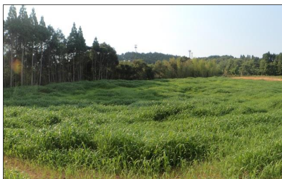
日南市 5 団地 飼料畑