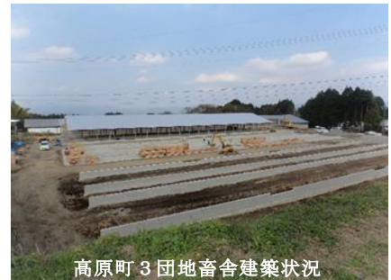
高原町3団地畜舎建築状況

また、畜産環境総合整備事業南那珂地区でも、攪拌機の交換や堆肥舎の補修などの堆肥処理施設の機能保全対策工事に11月から着手し、早期完成を目指して取り組んでいます。 【畜産施設課】