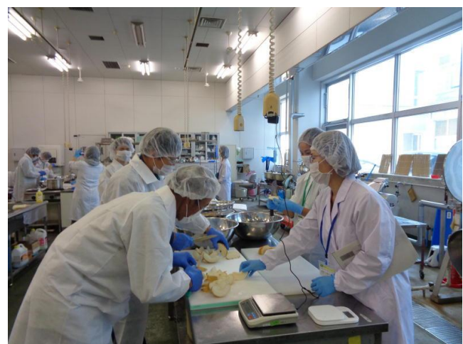
食品開発センターでの加工実習の様子