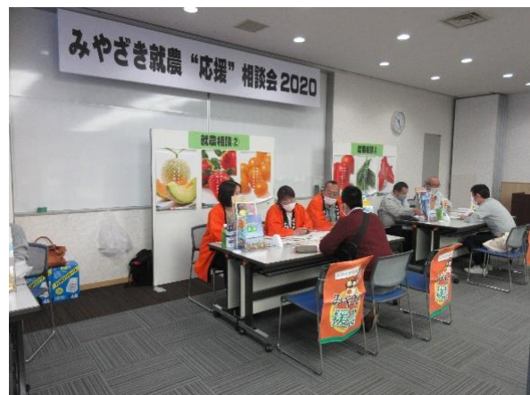
各ブースでの個別相談の様子