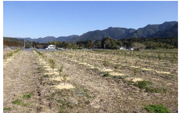
深谷地区（へべす植栽状況）