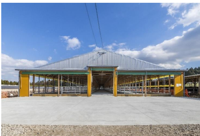
完成した繁殖牛舎